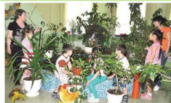
Даже в холодное время года можно оказаться на солнечной полянке.

Заходя в зимний сад, даже в холодное время года, малыши могут оказаться словно на солнечной полянке, среди множества цветущих и благоухающих растений. В такой обстановке хочется раздвинуть занавес и иметь положительной настрой. Ведь именно в этом и состоит эстетическая и психологическая прелесть зимнего сада.